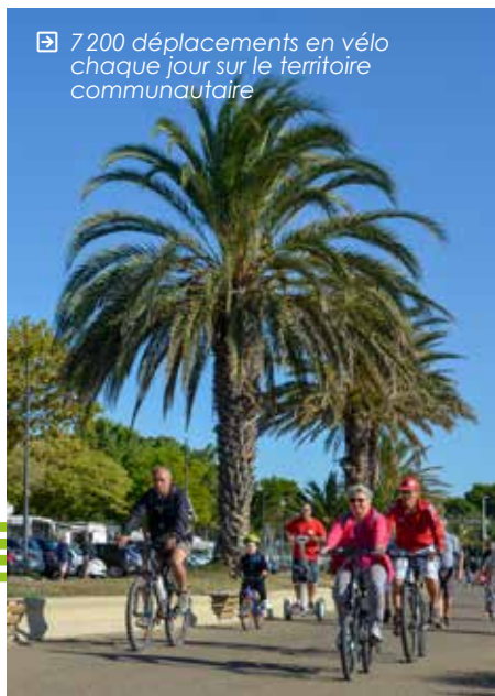
☞ 7 200 déplacements en vélo chaque jour sur le territoire communautaire

Près des 3/5 e des déplacements sont réalisés en voiture, y compris pour des distances courtes. Ainsi, 30 % des trajets en voiture font moins de 2 km ! Ces déplacements de proximité pourraient bien souvent être réalisés à pied ou en vélo , mais les habitudes de la voiture persistent encore pour beaucoup d'entre nous... On peut cependant noter la bonne place des modes actifs, c'est-à-dire, les modes de déplacements ne nécessitant pas d'énergie autre qu'humaine (vélo, marche à pied, roller...).