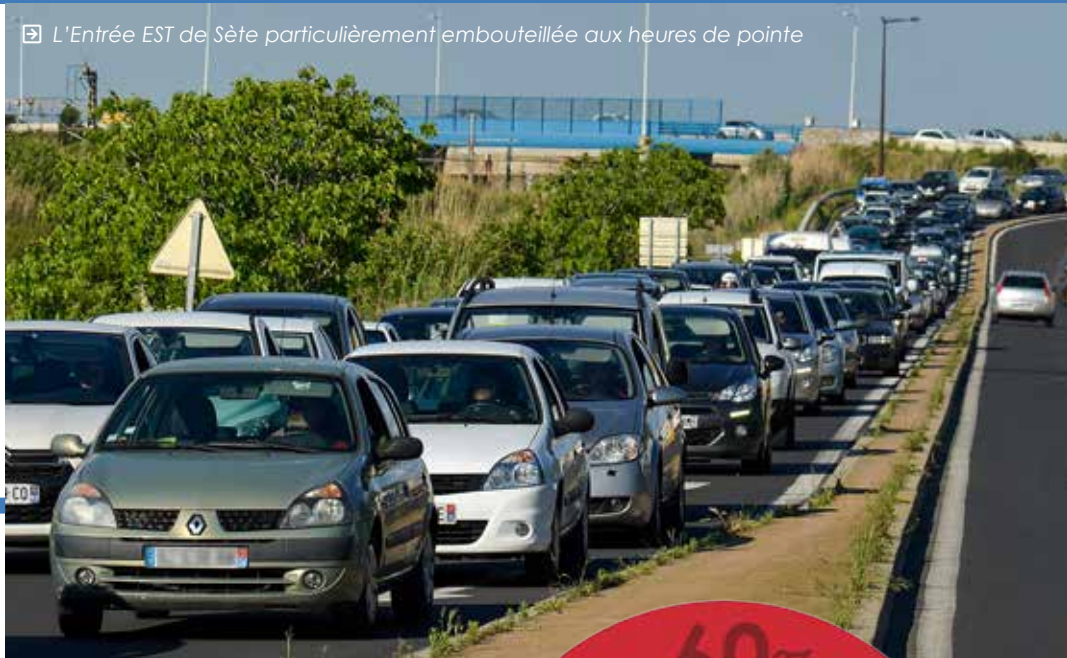
☞ L'Entrée EST de Sète particulièrement embouteillée aux heures de pointe