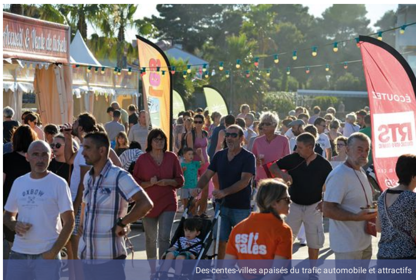
Des centres-villes apaisés du trafic automobile et attractifs

Dans nos communes, l'ambition du PDU est de réduire la place de la voiture, aux profits d'autres modes moins polluants et... moins consommateurs d'espace. En effet, une voiture passe environ 10% de son temps en circulation et donc... 90% à l'arrêt, c'est-à-dire en stationnement. Par ailleurs, une voiture se déplace là où elle peut stationner. Le stationnement demeure le levier d'action le plus efficace pour limiter l'usage de la voiture. Attention, il ne s'agit pas de supprimer totalement la voiture, mais simplement de réaffecter une part de l'espace public à d'autres usages, au profit d'une meilleure qualité de ville pour tous.